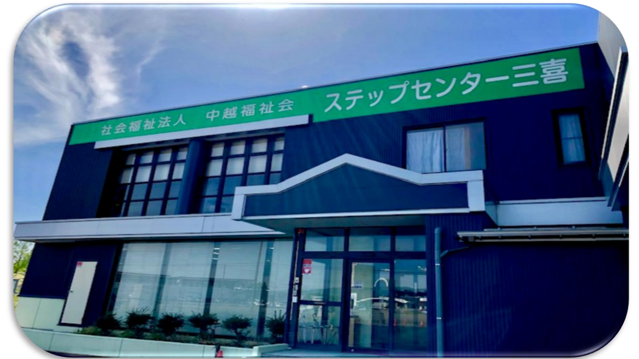
ステップセンター三喜外観