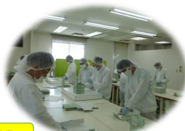
ハンガー拭き作業